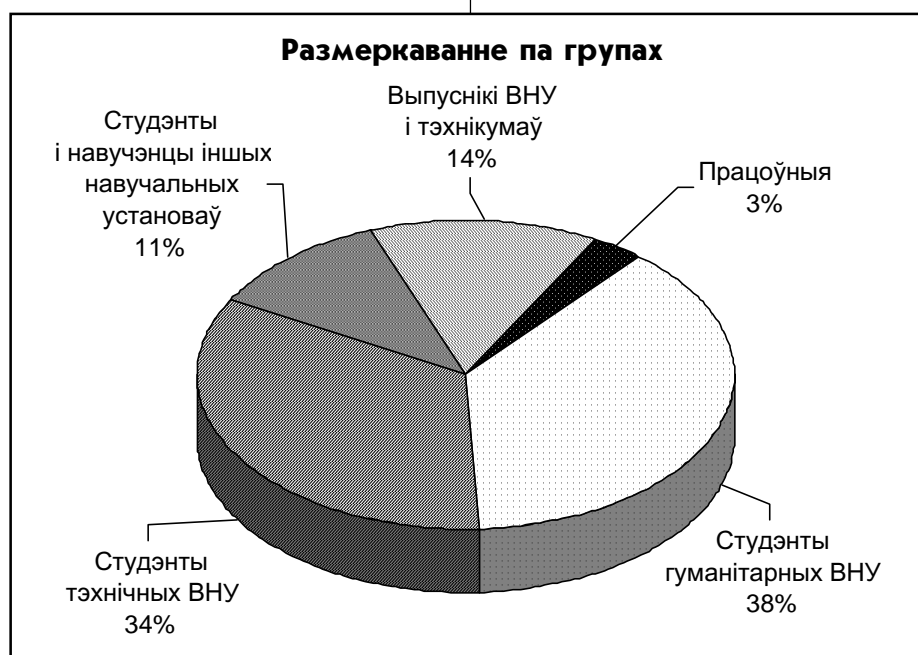
Размеркаванне па групам

Такая методыка падаецца непаўнавартаснай, што і было выяўлена ў выпадках, калі некаторыя каардынатары, якія арганізавалі назіранне за выбарамі з Палату Прадстаўнікоў Нацыянальнага Сходу РБ восенню 2000 г., не змаглі прыняць удзел у назіранні за выбарамі Прэзідэнта РБ. Значная частка маладых назіральнікаў, якія былі прыцягнуты імі па вызначанай методыцы адмовілася ад пра-