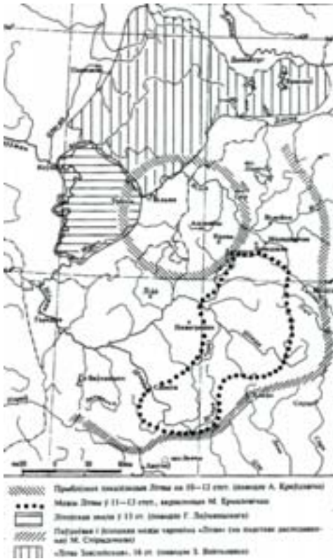
Мал. 3. Лакалізацыя сярэднявечнай Літвы (паводле Аляксандра Краўцэвіча)

прыняўшы ўсходнеславянскую сістэму дзяржаўнай арганізацыі і старабеларускую мову ў якасці дзяржаўнай. Базавая выснова А. Краўцэвіча наступная: ВКЛ з самага пачатку было біэтнічнай балта-ўсходнеславянскай дзяржавай з дамінаваннем усходнеславянскага элемента (1998: 174; 2000: 180). Варта адзначыць, што калі апошняю выснову (пра дамінаванне) прыкласці да палітычнай гісторыі ВКЛ сярэдзіны XIII–XIV стагоддзяў, то яна відавочна не спрацоўвае. Хоць лакалізацыя А. Краўцэвічам “старажытнай Літвы” ў межах Віленскага краю (у шырокім яго разуменні)