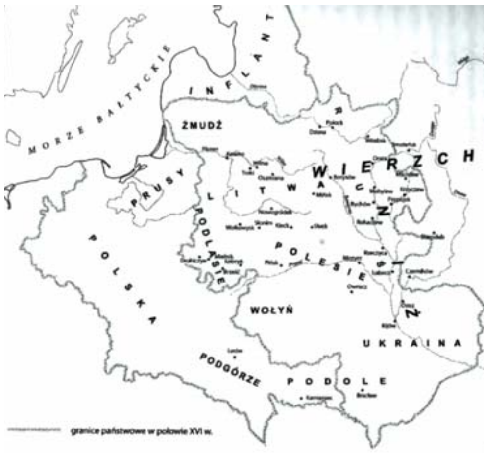
Мал. 8. Гістарычна-геаграфічныя рэгіёны ВКЛ XVI ст. паводле Алега Латышонка

на ўвазе пад “Рускімі землямі” – Рускае ваяводства з цэнтрам у Львове, бо прыгавдаецца імя рускага ваяводы Ежы Язлавецкага з Бучача. Менавіта ўкраінскія землі былі ў першую чаргу аб’ектам нападаў крымскіх татар.