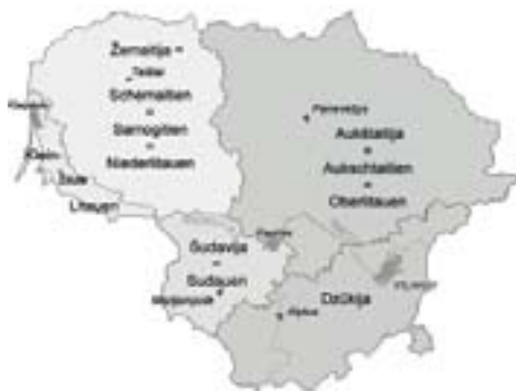
Мал. 6. Этнакультурныя рэгіёны сучаснай Літоўскай Рэспублікі (паводле сучаснага падзелу ў гуманітарных дысцыплінах)

важныя для літоўскай культуры дзеячы, напрыклад, Мікалоюс Даўкша (1527–1613). 4 З. Зінкявічус мяркуе, што пісьмовая літоўская (усходне-аўкштайцкая) мова знікла на пачатку XVIII ст. (Зінкявичюс, 1996: 126). У любым выпадку мы мусім канстатаваць, што сфера пісьмовага ўжывання гэтай мовы была вельмі абмежаванай і мова ніколі не дасягнула афіцыйнага статусу. Гэта, фактычна, былі толькі асобныя нататкі рэлігійнага зместу (Дзярновіч, 2011а: 117–119).