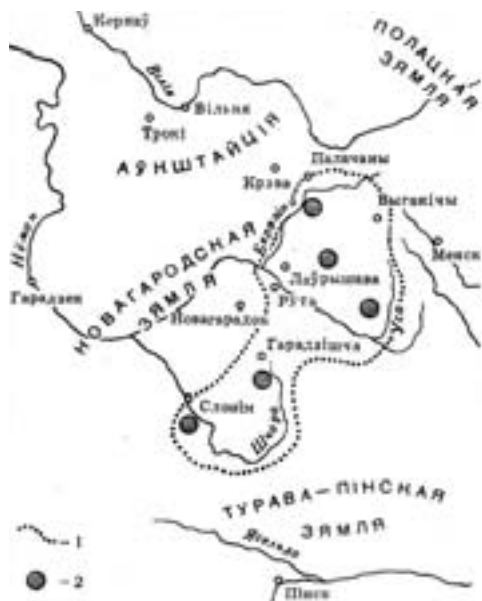
Мал. 1. Межы старажытнай Літвы паводле М. Ермаловіча: 1 – прыблізныя межы старажытнай Літвы; 2 – тапонім “Літва”

вецкага падполля, ужо ў другой палове 1980-х гадоў гэтая канцэпцыя атрымала інстытуцыянальнае, фармальнае акадэмічнае завяршэнне і трапіла ў гісторыка-публіцыстычную, папулярную літаратуру ды стала актыўна там выкарыстоўвацца. Яркім прыкладам тут могуць быць кнігі Уладзіміра Арлова (1994, 136–137; 2003: 78) і Вітаўта Чаропкі (1994: 96–100).