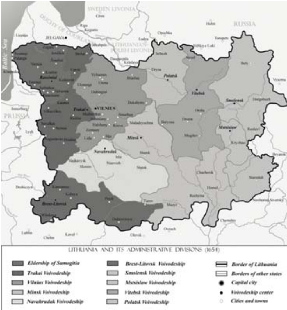
Мал. 5. Вялікае Княства Літоўскае ў XVII ст. Тэрыторыя Жамойцкага княства займае самы паўночны захад дзяржавы

Такім чынам, “жамойцкай мовай” у часы ВКЛ называлі заходні варыянт літоўскай (аўкштайцкай) мовы, які не мае адносін да сучасных жамойцкіх гаворак (Зинкявичус, 1999: 33). На гэтай “жамойцкай мове” пісалі многія