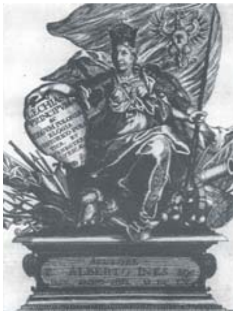
Іл. 14. Алегарычная выява Рэчы Паспалітай з тытульнага ліста Лехіяды А. Інэса. Кракаў, 1655 год.