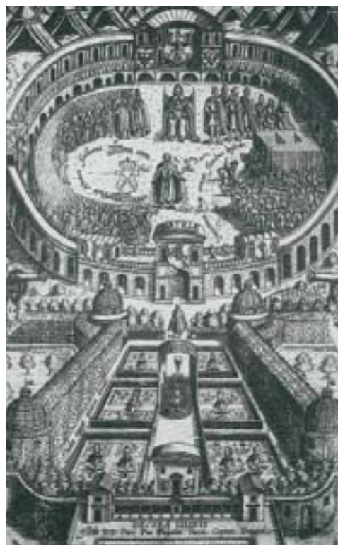
Іл. 13. Тытульны ліст да Decora Liliet Petri Pac. К. Гётке, Вільня 1642 год.

Інтэрпрэтаваць такі вобраз Айчыны можна вельмі па-рознаму. Хутчэй