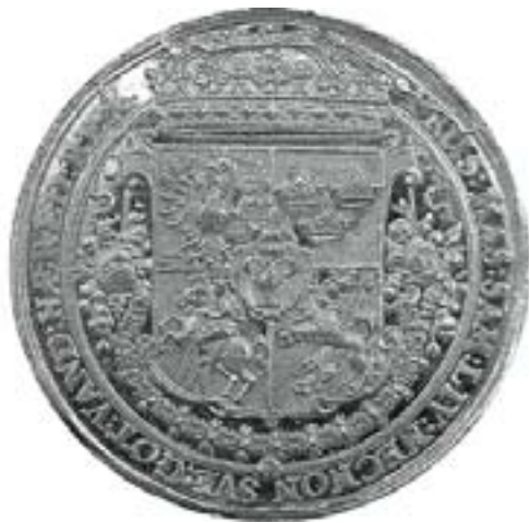
Іл. 7. Медаль Уладзіслава IV. Ё. Хён, 1640-я гады.