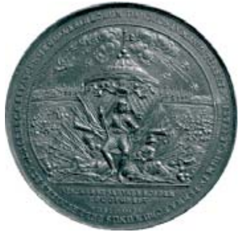
Іл. 5. Медаль у гонар перамогі Уладзіслава IV пад Смаленскам. С. Дадлер, Гданьск, 1634 год.

Ланцуг асацыяцый, вылучаны вышэй, тут відавочны. Па-першае, смаленская перамога 1634 года была ў вялікай ступені заслугой войскаў і ваенных лідараў ВКЛ. Па-другое,