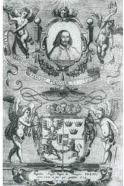
Іл. 9. Тытульны ліст да Via augusta, qua Carolus Ferdinandus з выявай герба Кароля Фердынанда Вазы. К. Гётке, Вільня, 1644 год.

Швецыі, а вакол на асобных кружках у лаўровых вянках падвойныя гербы Польшчы і Літвы; зверху і знізу ў такіх самых кругах – каралеўская карона і вялікакняжская шапка.