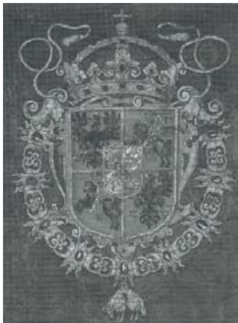
Іл. 12. Вымпел да трубы або барабана гвардыі Жыгімонта III Вазы з яго гербам. 1610-1630-я гады.