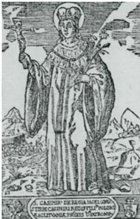
Іл. 3. Святы Казімір. Вільня, 1604 год.

ідэалагічнай (культ каталіцкага святога, патрона Літвы). Сам візуальны вобраз святога – малады чалавек у вялікакняскай шапцы, чырвонай княскай мантыі на футры (Ярашэвіч, 2002) – асацыяваўся з Літвой і выклікаў згаданыя дынастычныя і рэлігійныя канатацыі (іл. 3).