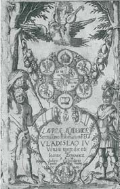
Іл. 10. Тытульны ліст да Laurae Academicae Serenissimo Poloniarum Regi Vladislavo IV з выявай герба Уладзіслава IV Вазы. Вільня, 1633 год.

шаюцца алегарычныя постаці Улады, якая трымае ў руцэ Фартуну (у традыцыйнай іканаграфіі: дзяўчына на шары з ветразем у руках), і Славы з лаўровымі галінкамі, што разам падтрымліваюць партрэт караля. Арол (які адсылае нас адначасова да польскай і прускай геральдыкі і сімвалаў улады антычнага Рыма) трымае лаўровы вянок над галавой манарха. Унізе змешчаныя трафеі і палонныя маскоўцы ды туркі. Гербы Польшчы і Швецыі знаходзяцца ўверсе каля партрэта караля разам з гербам Ва-