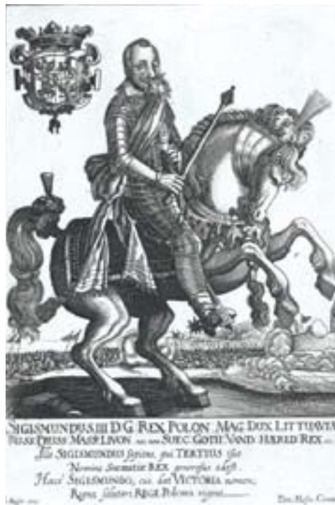
Іл. 4. Жыгімонт III Ваза. Э. Кезер, Франкфурт-на-Майне, 1620-я гады.

Агульны пасыл коннага партрэта – адлюстраванне караля як дасканаллага вершніка, а таксама