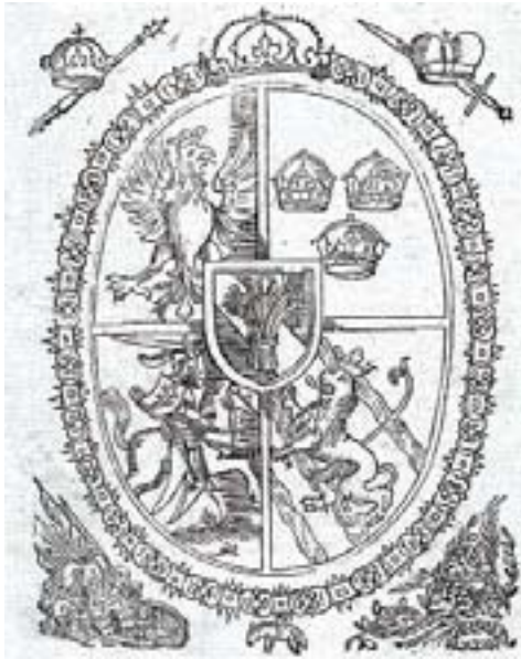
Іл. 8. Герб Жыгімонта III Вазы. Вільня, 1632 год.

Вельмі цікавы, але крыху іншы, набліжаны да класічнай іканаграфіі, герб польскіх Вазаў, можна знайсці на тытульным лісце Laurae Academicae Serenissimo Poloniarum Regi Vladislao IV Яна Зяновіча (Zenowicz, 1633). 7 Акрамя шматлікіх алегарычных вобразаў (Апалон на арле, рогі багацця, тытаны і іншыя), варта звярнуць увагу на інтэрпрэтацыю герба: усярэдзіне падвойны герб