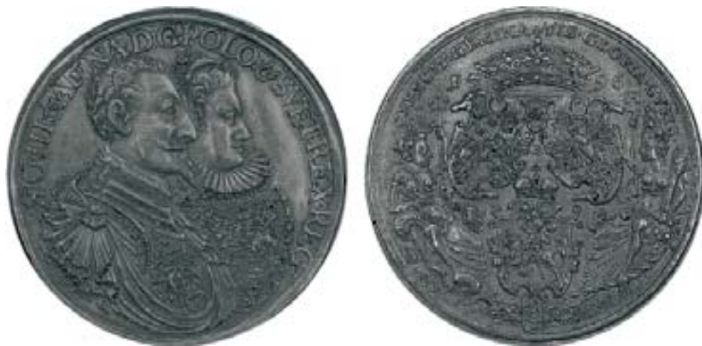
Іл. 6. Шлюбны медаль Жыгімонта III Вазы і Канстанцыі Габсбург. Г. Леман, 1596 год.

Пра тое, што гэта не выпадковы матыў, сведчыць і медаль Жыгімонта III Вазы невядомага майстра 1608 года. На аверсе мы бачым партрэт караля ў даспехах, а на рэверсе – схематычную выяву трох гербаў (без герба Аўстрыі), акружаных лаўровым