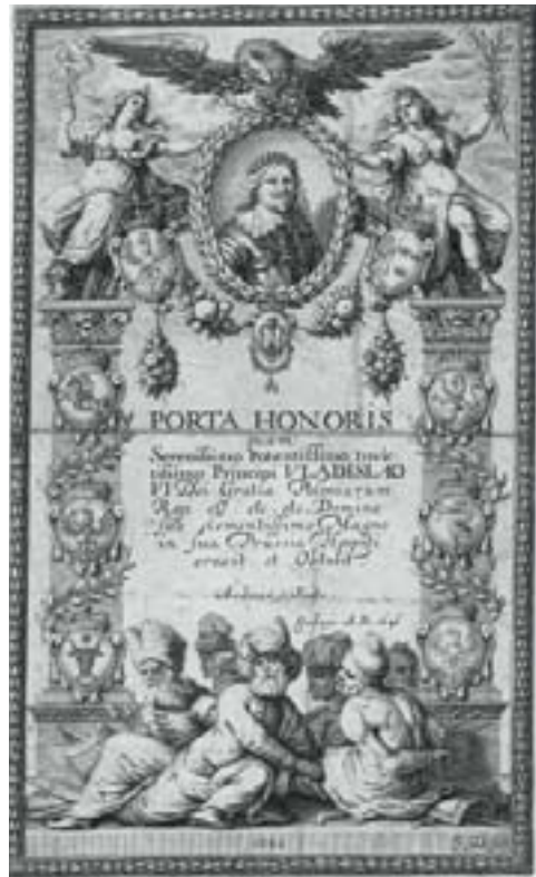
Іл. 11. Трыумфальная арка ў гонар караля Уладзіслава IV. Е. Фальк, Гданьск, 1646 год.

Зрэшты, трэба заўважыць, што падобныя інтэрпрэтацыі геральдыкі каралёў з дынастыі Вазаў былі хутчэй рэдкасцю, і значна часцей мы сустракаем складаны падвойны герб Рэчы Паспалітай і Швецыі, апісаны вышэй (іл. 12).