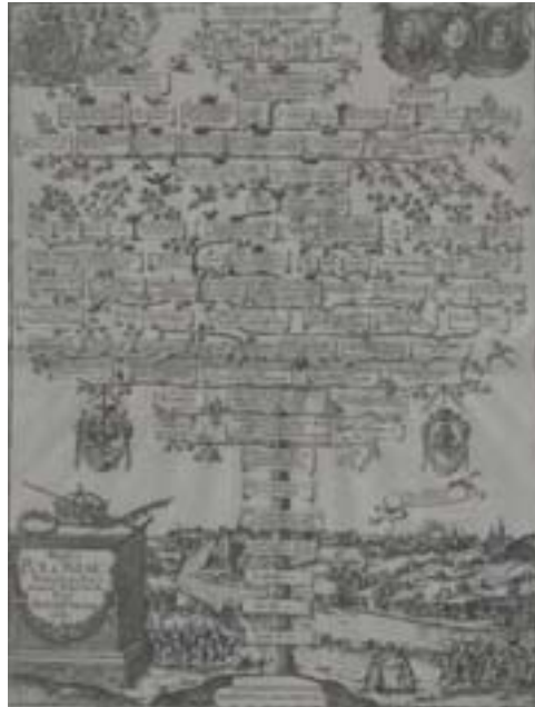
Іл. 1. Генеалагічнае дрэва Жыгімонта III Вазы. Д. Кустас, Аўгсбург, 1612 год.

Нягледзячы на тое, што гравюра досыць вядомая, польскія даследчыкі звычайна мімаходзь згадваюць пра яе, улічваючы, што найбольш распаўсюджанай візуалізацыяй прапагандысцкага варыянта генеалагіч-